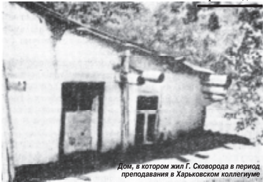
Дом, в котором жил Г. Сковорода в период преподавания в Харьковском коллегии

Сквозь сон я услышала женский крик. Крик его матери. Встав со своей кровати, я зашла в соседнюю комнату. Его лицо было спокойно. Он был мертв.