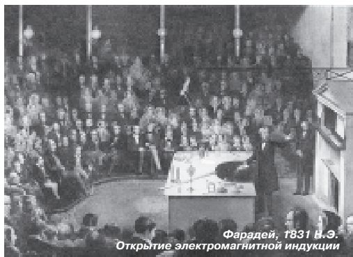
Фарадей, 1831 г. Э. Открытие электромагнитной индукции